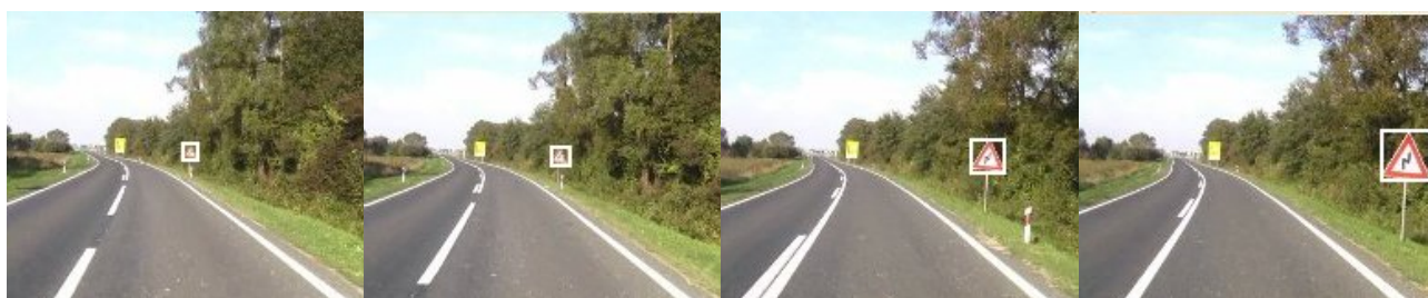
Slika 2: Primjer ispravnog označavanja znaka