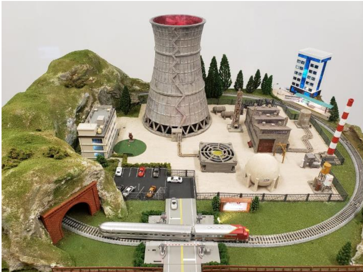
Slika 3.3 Model fizičkog procesa simulacijskog okvira Sveučilišta Rowan [40]

Katarsko sveučilište uz potporu NATO saveza je razvilo simulacijski okvir koji simulira Tennessee Eastman proces u stvarnom vremenu [42]. Okvir je konstruiran kako bi se pomoću njega proveli kibernetički napadi na upravljački sustav te se pomoću podataka prikupljenima tokom napada evaluirali različiti algoritmi za otkrivanje napada. Fizički proces je ostvaren računalnom simulacijom koji su preko sučelja spojeni na stvarne ulazno-izlazne module. Cijeli upravljački dio je izgrađen korištenjem Siemens PLC-ova, dok se komunikacija u sustavu odvija PROFINET i S7 protokolima. Kibernetički napadi provedeni korištenjem okvira su iskorištavali ranjivosti PROFINET protokola kako bi ubacili lažne podatke u upravljački dio sustava te je proučavan njihov utjecaj na rad sustava. Kako bi se takvi napadi uočili u okviru su implementirani algoritmi strojnog učenja za otkrivanje napada koji su napade uspješno detektirali uz relativno visoku uspješnost.